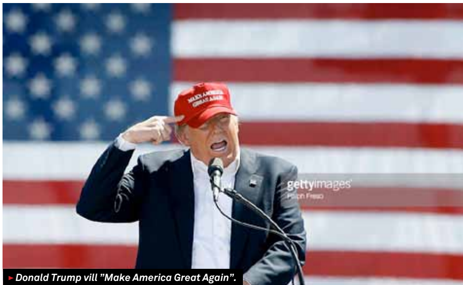
► Donald Trump vill "Make America Great Again".

Den andra idén som behöver återupprättas är vikten av nyansering och detaljkänedom. Om uppgiften är att moderera kapitalismen i ett samhälle och en värld präglad stor mångfald och komplexitet, duger det inte att enbart vara vägledad av vad som från ekonomisk synpunkt uppfattas som det enda möjliga. Ty själva poängen med det finns en "kultur" och en "modernitet" är att vi inrättar undervisning, vård, rättsväsen, partsförhållanden på arbetsmarknaden och alla andra omfördelningar av livsutsikter på ett sätt som inte är det enda möjliga. Det är skälet till varför vi behöver underkasta oss ett ständigt fortgående utredande, debatterande och förhandlande. Med andra ord räcker det inte med legitim opposition. Det krävs också en allmänt utbredd insikt om reformismen som nödvändig metod för att kontinuerligt bearbeta spänningen mellan skilda mål och olika intressen.