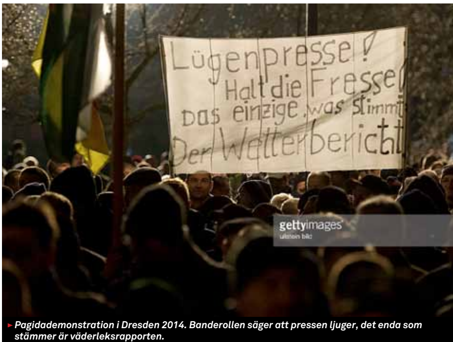
► Pagidademonstration i Dresden 2014. Banderollen säger att pressen ljuger, det enda som stämmer är väderleksrapporten.

Detta är inte detsamma som att varje land för sig konstitutionellt binder sig. En egen grundlag går att ändra. Men de politiska partierna reducerar sina möjligheter att på grundval av sammanjämkade idéer och intressen ta ställning till målkonflikter. Ländernas regeringar, förvaltningar och domstolar får tillfälle att – med mindre hänsyn tagen till idéer och intressen i det egna landet – tillämpa ett unionsfördrag. Poängen är att detta inte är någon grundlag som länderna på egen hand kan ändra. Det reformistiska utrymmet för att lära av erfarenheten minskar därigenom i vart och ett av medlemsländerna. De nationella statskickerna omvandlas utan att