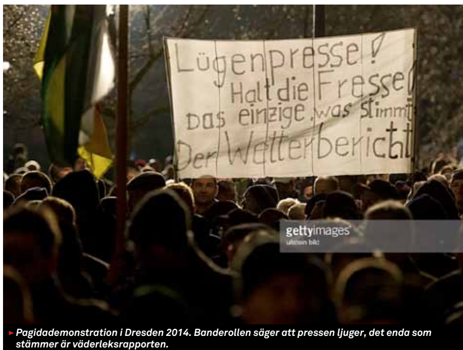
► Pagidademonstration i Dresden 2014. Banderollen säger att pressen ljuger, det enda som stämmer är väderleksrapporten.

Detta är inte detsamma som att varje land för sig konstitutionellt binder sig. En egen grundlag går att ändra. Men de politiska partierna reducerar sina möjligheter att på grundval av sammanjämkade idéer och intressen ta ställning till målkonflikter. Ländernas regeringar, förvaltningar och domstolar får tillfälle att – med mindre hänsyn tagen till idéer och intressen i det egna landet – tillämpa ett unionsfördrag. Poängen är att detta inte är någon grundlag som länderna på egen hand kan ändra. Det reformistiska utrymmet för att lära av erfarenheten minskar därigenom i vart och ett av medlemsländerna. De nationella statskickerna omvandlas utan att