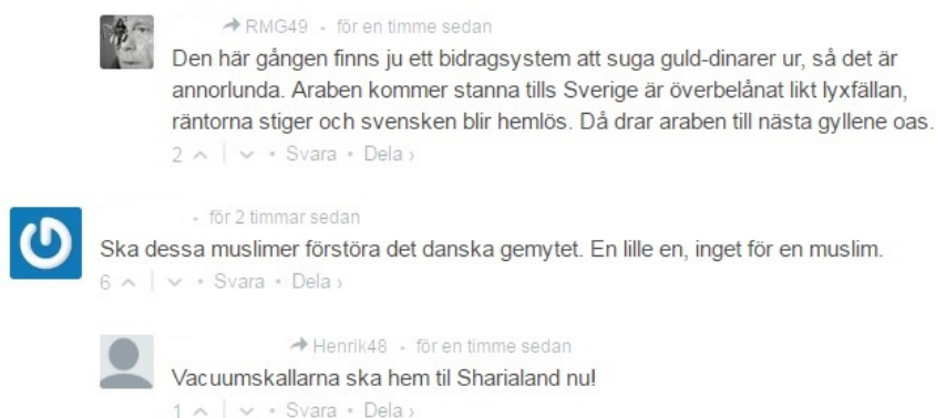
Figur 1 visar en skärmdump ifrån ett av Avpixlats kommentarsfält

http://expo.se/2012/hatstorm-mot-tjansteman-efter-avpixlat-artikel_4896.html ). Under senare år är sidan även frekvent omdiskuterad i både media och politik. Namnet Avpixlat grundar sig i en kritik av traditionell media vilken anses censurera innehåll till invandrares fördel med hjälp av pixlingar. Namnet kan således förstås grundat i en negativ inställning till personer som invandrat, där dessa personer målas upp som en grupp som hotar svenskheten. Avpixlat består av kommentarsfält där besökare kan kommentera publicerade artiklar om bland annat invandring. Det går att vara anonym och kommentarsfälten beskrivs som en plats med högt i takhöjd avsedda att diskutera exempelvis attityder till invandrare. Nästan uteslutningsvis kan kommentarerna förstås fokusera kring invandrare som ett hot mot exempelvis ”det svenska välfärdssystemet” eller bostadsmarknaden. Ett exempel för att demonstrera ett av kommentarsfälten visas nedan där besökarnas namn är censurerade.