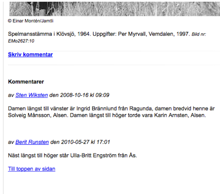
Figur 2. Kommentarsfält under en bild i det digitala bildarkivet.