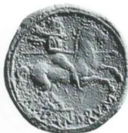
Fig. 3 Frånsidan av ett HISPANORVM-mynt.