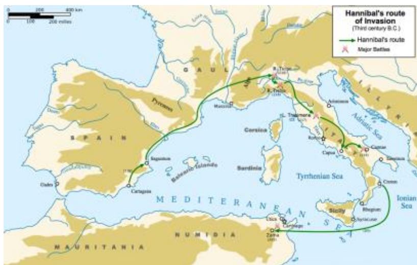
Fig. 2 Hannibals krigståg till Italien och sedan till Karthago.