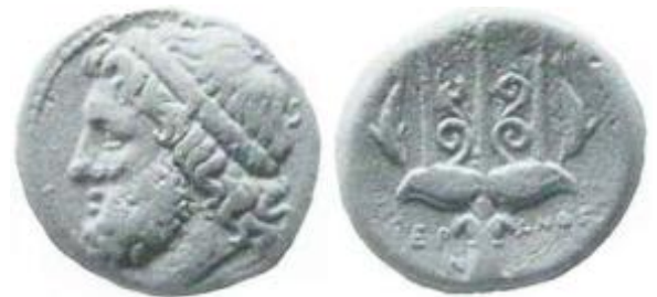
Fig. 5 T.v.: åtsidan av ett helt Poseidon/treuddsmynt. T.h.: frånsidan av myntet.

Holloway menar att romarna använde Poseidon/treudd-mynten och slog om dem för att göra quadranter, sextanter och unciae (dessa är mynt av olika värden). Med tiden så började romerska mynt (bland annat sextanter och quadranter) väga mindre och mindre, och