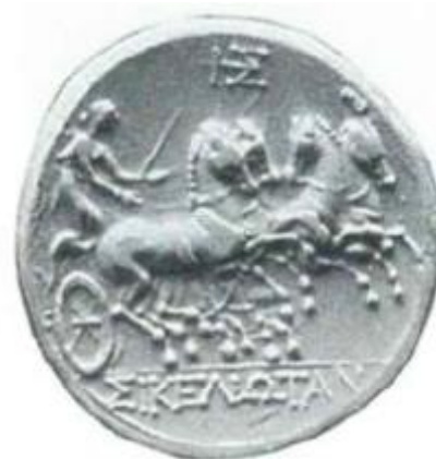
Fig. 4 Frånsidan av ett ΣΙΚΕΛΙΩΤΑΝ-mynt. Notera monogrammet högst upp på myntet.