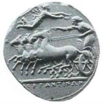
Fig. 7 Frånsidan av ett ΜΟΡΓΑΝΤΙΝΩΝ-mynt.

Trots att ΣΙΚΕΛΙΩΤΑΝ och HISPANORUM-mynten är viktiga finns det även många andra viktiga mynt från Morgantina. Intressant att lyfta fram för att jämföra med ΣΙΚΕΛΙΩΤΑΝ-mynten och dess monogram är ΜΟΡΓΑΝΤΙΝΩΝ-mynten (Fig. 7). Dessa mynt har daterats till ca 370–310 f.v.t. 51 Frågan här är att om Sjöqvists teori om monogrammet är korrekt (att Η ska tolkas som Morgantina), varför slog man inte istället stadens namn som tidigare hade gjorts i Morgantina? Det här kommer behandlas vidare i kapitel 5.