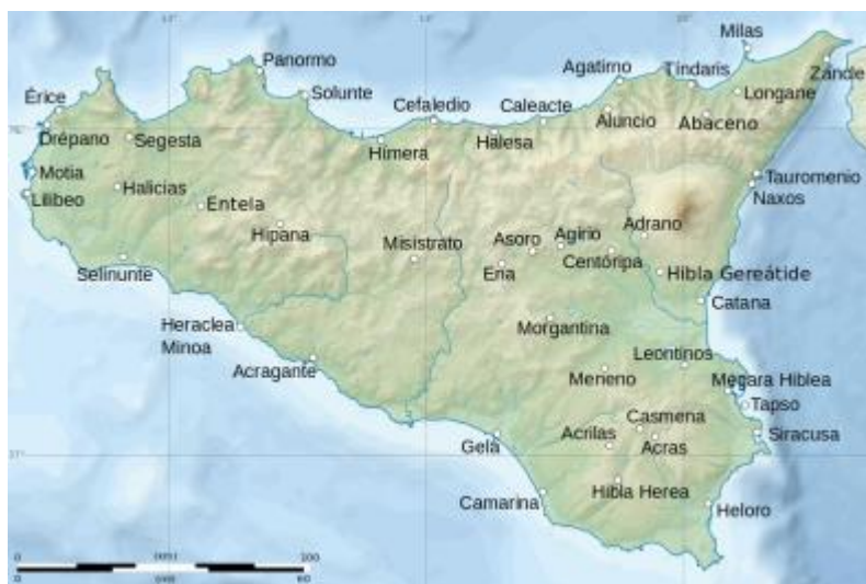
Fig. 8 Karta över Sicilien, notera var Morgantina ligger.

Man kan fråga sig om staden vi nu konstaterat är Morgantina spelade en roll under det andra puniska kriget. I den undersökning som har bedrivits för den här uppsatsen finns det inte (som tidigare nämnt) någon evidens för att Morgantina var delaktiga i kriget. Man kan dock förutsätta att ifall Morgantina var i förbund med Syrakusa så var Syrakusas aktioner stödda av Morgantina. Utifrån det som har lyfts fram i uppsatsen kan det antas att Morgantina var en del av ett koinon tillsammans med Syrakusa. Detta är baserat till stor del på det tydliga