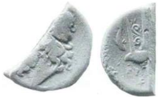
Fig. 6 T.v.: åtsidan av ett halvt Poseidon/treuddsmynt. T.h.: frånsidan av samma mynt. Notera hur noggrant myntet har halverats.

Poseidon/treudd-mynten användes då för att skapa romerska mynt av högre värden. Ett problem med de halverade Poseidon/treudd-mynten är att det inte finns en säker valör av det halva myntet. Holloway argumenterar för att mynten ska tolkas som en lokal ersättare av unciae. 49 Det är något som styrks av fyra andra Poseidon/treuddsmynt som har hittats som istället för att vara halverade är delade i fjärdedelar. Eftersom det inte finns något som är värt mindre i den romerska myntskalan än semuncia (en halv uncia) måste \frac{1}{4} Poseidon/treudd-mynt vara en semuncia. Därmed blir ett \frac{1}{2} Poseidon/treudd-mynt en uncia. 50 Den överskuggande frågan är när dessa mynt började halveras. Var det före eller efter Morgantinas fall? Ett förslag gällande detta kommer att analyseras och argumenteras för i kapitel 5.