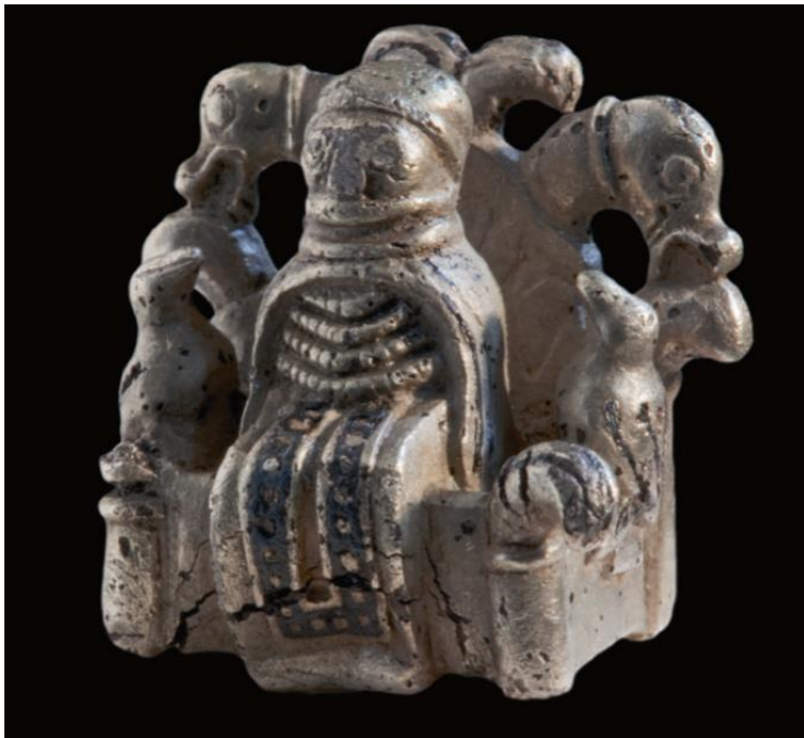
Figur 5 Möjlig Oden-figurin från Lejre, Danmark (Christensen 2009:174).

År 2009 i Lejre, Danmark hittades en liten silverfigurin, daterad till 900-talet (18mm hög 20 mm bred) som föreställer en person i kvinnligt kodade kläder, sittande på en stol/högsäte med två fåglar, troligen Odens korpar. Denna lilla figur har tolkats som Oden i kvinnokläder. Personen har en lång klänning och ett smycke på bröstet. Figuren är tydligt iklädd kvinnodräkt, men ansiktet har möjligen ett skägg (Christensen 2009:177). Om figurinen tolkas som Oden så finns den många likheter i framställningen av Oden i de skriftliga källorna, och Odens flytande genus, men även med Vivalen, kanske tillhörde Vivalen ett tredje genus, en typ av schaman som iklädde sig både manliga och kvinnliga attribut? Oden anammande kvinnlighet genom sitt sejdande, och kunde även uppträda i kvinnokläder (Solli 2002). Något som stämmer väl överens med figurinens framställning. Antingen föreställer den en kvinnligt kodad person, eller så föreställer den faktiskt Oden, eller en schaman, likt schamanen från Vivalen. Detta skulle i så fall betona de genusaspekter som inte är cis-normativa, och kan ses som ett bevis för att personer utanför det cis-normativa fanns med i föreställningsvärlden under vikingatiden.