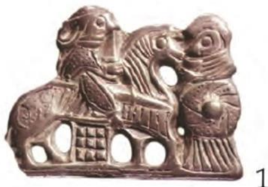
Figur 4 Så kallad Valkyriebrosch, Tisø, Danmark (Vang Petersen 2005, 77).

Bilden av kvinnan under vikingatiden är ofta kopplad till hushållet, och att de förblev hemma och tog hand om gården medan manliga släktingar reste utomlands. Detta menar Jesch är bara delvis sant, då det både i källor och arkeologiskt material finns bevis på att kvinnor också följde med på dessa resor. Skandinaviska kvinnors gravar, identifierade genom smyckena, har hittats bland annat på Grönland och i Ryssland (Jesch 1991:35).