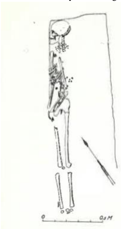
Figur 1 Plan över grav 9 från Vivallen

Gravarna påträffades i sydslänten av den ca två meter höga sandrygg som finns på platsen. De flesta gravarna i Vivallen låg tätt i förhållande till varandra, i smala gropar (vissa var endast 25 cm breda), med fötterna pekande mot den närliggande bäcken. De flesta av de döda var gravlagda på sidan och hårt svepta i näver. Den hårda svenpingenen kan, enligt Zachrisson, ha möjliggjort att få plats med kropparna i de smala groparna (1997:56). Inga spår efter kistor har påträffats, men många är lagda ovanpå ett lager av växter, eller annat organiskt material.