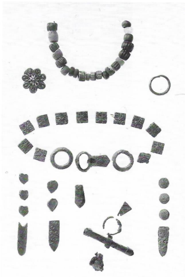
Figur 2 Gravgoods från grav 9 från Vivallen (Zachrisson 1997:62).

Innehållet i grav 9 visade både maskulint kodade föremål, och feminint kodade föremål, nedan följer en beskrivning av föremålen som återfanns i graven. De flesta av artefakterna i graven klassas vanligen som kvinnliga i skandinaviska sammanhang (Zachrisson 1997:78). Gravfältet är samiskt och grav 9 har p.g.a. bältet daterats till slutet av 1100-talet. Men paralleller finns till flera av artefakterna i Birka, såsom nålhuset (Zachrisson 1997: 67), kniven (Zachrisson 1997: 68), textilplagg (Zachrisson 1997: 70) och bälten jämförbara med det som återfanns i grav 9 har även hittats i Birka (och på Gotland) (Gollwitzer 1997:73).