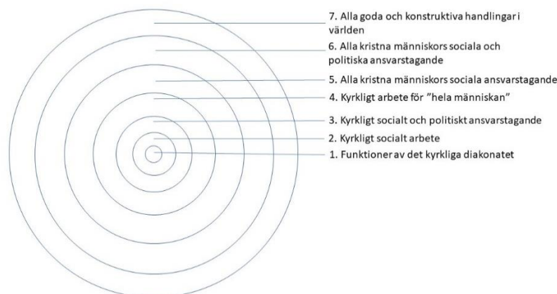
Figur 1: Ett koncentriskt diakonibegrepp. Källa: Blenning (1989) s 43 – 48

Några av dessa komplexiteter fångas i Erik Blenningers ”koncentriska diakonibegrepp”, som han beskriver som ett sätt att samordna definitionsförslag för diakoni, från en snäv diakonibestämmning till ett allt vidare begreppsomfång. 13