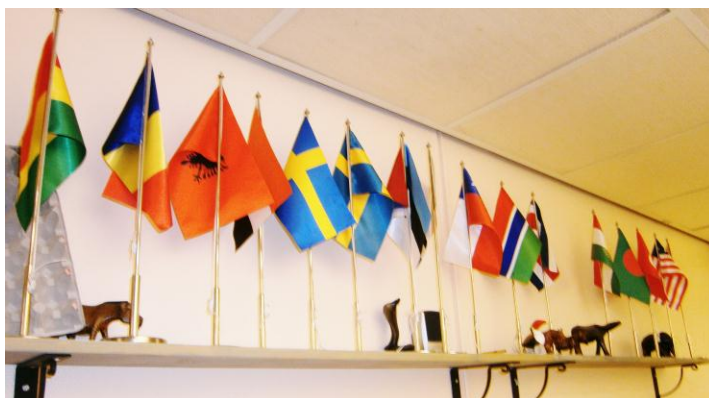
Bild1: Varje barns bakgrund lyfts fram genom en flagga på väggen