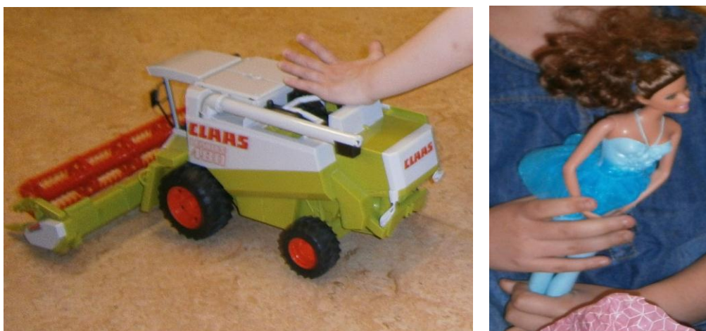
Bild 5: Val av medhavda leksaker synliggör könsstereotypa lekar och intressen bland barnen

lekrummet finns en ring med markeringar på golvet. Varje markering är en liten lapp med ett barns namn på. Här ska hon eller han sitta vid samlingarna. Före själva visningen pågår ett stort hemlighetsmakeri. Barnen gömmer sina medhavda saker i plastpåsar, bakom ryggen, i lådor i en byrå eller på något annat ställe så ingen ska kunna "tjuvkika" i förväg. Barnen plockar fram sina saker en och en, och ganska snart står det klart att det finns en tydlig könsstereotyp bild med i barnens val av leksaker. Pojkar har valt att ta med sig lastbil, bil, skördtröska, ett litet digitalt handspel med Indiana Jones, Beyblade och en lekssakspistol (det fick de egentligen inte ta med sa en pedagog lite tyst). Flickorna har med Barbie, en liten rosa leksaksfigur, mjukisdjur. De icke könsstereotypa saker som hade tagits med var ett CD-spelet Kalle Kunskap till datorn (flicka), en egen teckning (pojke) och en liten egenhändigt gjord tavla (flicka). Det generella intrycket är att i detta sammanhang där barnen styr är könsstereotyper tydligt framträdande.