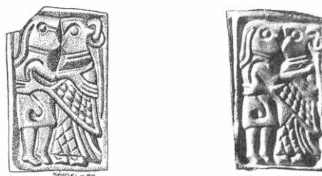
Fig. 1. Avritning (vänster) och fotografi (höger) av guldgubbe från Helgö, guldgubbe nr 603. Förstorad.

Vikstrands argument för att Asknäs är Helgös storgård består bland annat av att gården i den sannolikt medeltida Erikskrönikan sägs höra till Jon Jarl. Det måste poängteras att Rimkrönikan om Erik skrevs åtskilliga hundratalet år efter Helgös blomstringstid. En annan indikation, menar Vikstrand, består av förekomsten av en storhög på 25 meter i diameter, som i