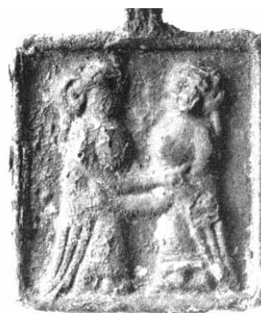
Fig. 3. Hänget i brons från Norsborgsgrav nr 21 i Botkyrka socken, Södermanland. Mycket förstora.