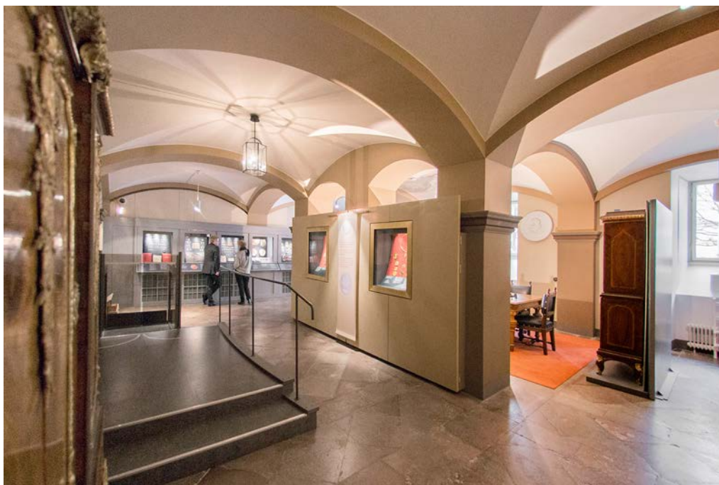
Utställningen i Uppsala universitets myntkabinett.

Den aktuella utställningen i Uppsala universitets myntkabinett tillkom under 2007 och 2008. Den möjliggjordes med hjälp av ett generöst bidrag från Sparbanksstiftelsen Upland. I utställningen visas ett urval om runt 400 objekt. Teman är Uppsala universitets historia, Sveriges historia och Upplands historia. Mer information finns i vårt Workingpaper " Om utställningen i Uppsala universitets myntkabinett ".