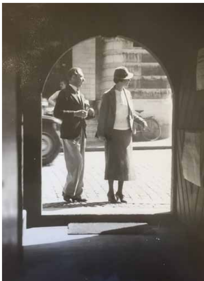
FIGUR 8. Ett besökande par på väg in i Burmeisterska huset. Utan datering, något beskuren.

Besöksfrekvensen till Burmeisterska huset har utan tvivel gått ner sedan 1993, som var den sista sommaren huset användes som turistbyrå. Turistbyråverksamheten expanderade kraftigt och det fanns mer ändamålsenliga lokaler att ta i anspråk. 94 Efter 1993 kom huset att endast öppnas för museets guidade visningar och därmed har antalet besökare också kommit att sjunka.