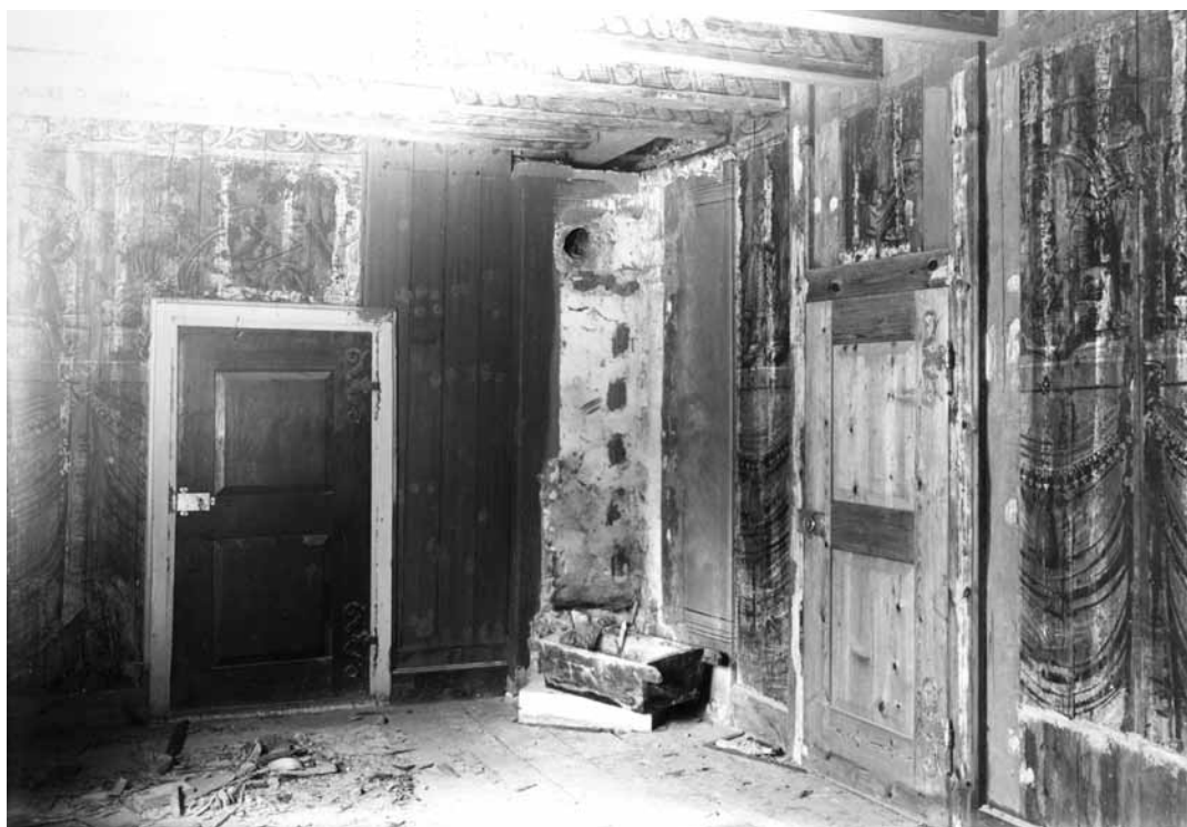
FIGUR 3-4. Fotografiet ovan visar att en eldstad i övervåningens nordöstra rum revs ut och ersattes med en öppen spis vid restaureringen. Väggmålningarna runt spisen fylldes i av Nordström. Omfattande skador på målningarna i rummet är synliga. Fotografiet nedan är taget av Sigurd Curman och visar resultatet. Båda odaterade men härrör från tidigt 1900-tal. KÄLLOR: Gotlands museum, Hugo Beyers samling, och Antikvariskt-topografiskt arkiv, Sigurd Curmans arkiv, vol. F7b.

monument. 62 Debatten, som särskilt gällde domkyrkorna och de äldre slotten, kom att få återverkningar på hur man förhöll sig till autenticitet och historisk utveckling i senare restaureringar. 63