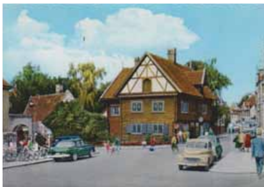
FIGUR 9. Vykort från sent 1950-tal eller 1960-tal. Murgrönan, som tidigare var en del av attraktionen, är avlägsnad och gavelröset rekonstruerat. Donners plats framstår som ett livligt promenadstråk, där också biltrafik var ett naturligt inslag.

Sommaren 2015 genomfördes turer för totalt 500 personer i huset. 95