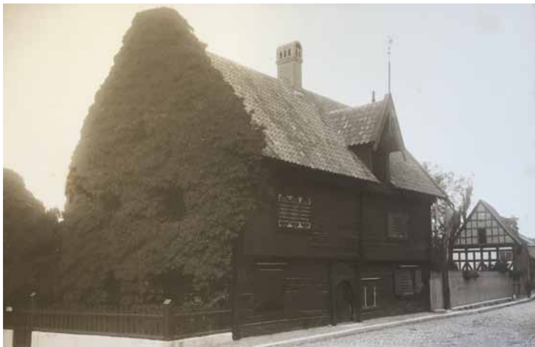
FIGUR 7. Burmeisterska huset som det såg ut mellan 1907 och 1942. Murgrönan täckte den södra gaveln till och med början av 1940-talet. Utan datering.

landen som Svahnström inte kunde påverka. Det ena var kriget, som innebar att man dokumenterade många kulturhistoriska byggnader i Sverige eftersom det före 1942 fanns en uppenbar risk att Sverige skulle dras in i kriget. Om hus skadades eller förstördes skulle de kunna återuppföras efter kriget. Det andra förhållandet var att den murgröna som helt täckte södergaveln dog på grund av den kalla vintern och behövde avlägsnas. Timmerväggen bakom visade sig vara i gott skick, eftersom den hade täckts med en panel. På 1800-talet hade hela huset varit täckt med panel, men på andra delar hade den avlägsnats.