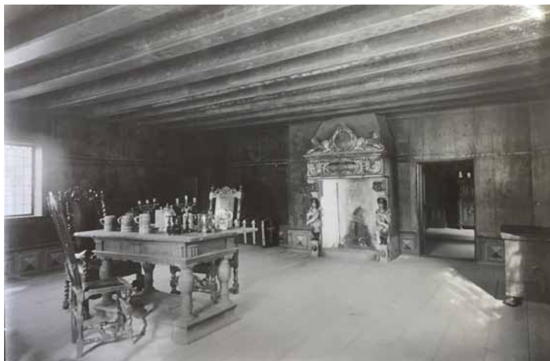
FIGUR 5. Övervåningen av Burmeisterska huset möblerades 1906 och blev ett museum som visades sommartid. KÄLLA: Visby landsarkiv, Landsarkivets fotosamling, vol. T11b:1.

svarade turistföreningen. 65 Fönstren borde förminska något, eftersom de hade bytts ut mot större under 1800-talet. Från bodluckan ut mot Strandgatan kunde karameller och små souvenirer säljas sommartid och det skulle också gå att få något att äta och dricka.