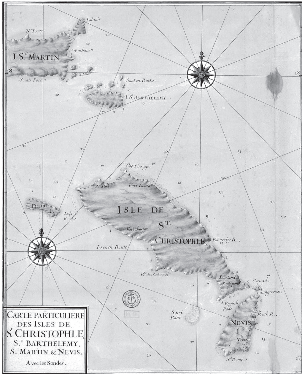
X, Carte particuliere des Isles de St. Christophle, St. Barthélemy, S. Martin & Nevis, XVIII e siècle.