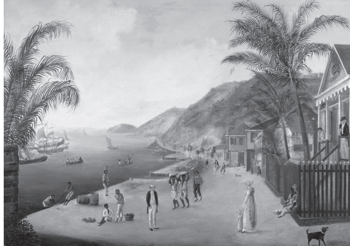
X, Quai à Saint-Barthélemy, dessin, XIX e siècle, Sjöhistoriskav – Maritime museum, Stockholm.

L'île est divisée en deux circonscriptions principales : la ville et la campagne. Quand les Suédois arrivent en 1785, la crique où se trouve la ville de Gustavia est pour l'essentiel inhabitée et utilisée pour la réparation des bateaux, d'où son premier nom de « le carénage ». La population française, restée après le rachat de l'île par les Suédois, occupe les zones rurales. Elle est constituée principalement de petits exploitants, pratiquant une agriculture de subsistance et possédant un nombre d'esclaves relativement restreint, assignés aux travaux agricoles et aux tâches domestiques. La division entre ville – cosmopolite et multilingue – et campagne – rurale et de langue française – est destinée à perdurer. Les données démographiques reflètent la construction de la ville et l'afflux de population dans l'île pendant les années où le commerce prospère à Saint-Barthélemy.