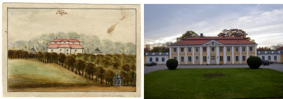
Bild 3: Höja säteri i Gryta i Uppland och Grensholmen i Vånga i Östergötland.