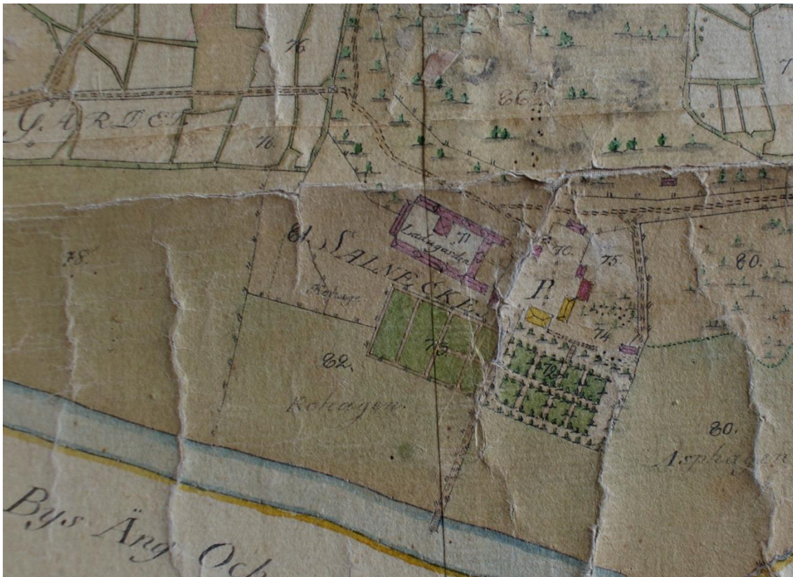
Bild 4: Salnecke herrgård med närmaste omgivning år 1805, då gården ägdes av greve Carl Gustaf Spens. Huvudbyggnaden omgavs av en flygelbyggnad av sten i öster, som innehöll kök och bryggghus, samt två timrade flyglar som var bostäder för gårdsdrängar och inspektoren. Längst norrut i mangården låg spannmåls- och visthusbodar där livsmedel förvarades. Väster om mangården låg ladugården med alla dess byggnader. Söder om huvudbyggnaden låg kålgårdar och en fruktträdgård. Karta på Salnecke gård.

ängsmarker, vilka sedan under ett par år besåddes med havre och lin och sedan med gräsfrö. 19 Man övergick också i större utsträckning till att odla blandsäd och havre, vilka sädesslag tillsammans med den ökade mängden halm kompenserade för den minskade hö-tillgången. På så kunde man hålla ett tillräckligt stort antal djur på gårdarna och därmed få gödsel. 20 Redan under 1700-talet omtalas djur som fodrades med halm och "mjölkdrick" istället för hö. 21 Redskapen utvecklades gradvis genom innovationer och mer järn började användas i dem vilket inte bara gjorde dem effektivare och mer slitstarka, utan dessutom medförde att man kunde göra dem mer avancerade. 22 En innovation av största betydelse var tröskverket. Utvecklat i Skottland slog det igenom i Mellansverige under tidigt 1800-tal. De drevs med hästar eller oxar och halverade tidsåtgången per tunna tröskad spannmål. 23 På både Höja och Salnecke omtalas tröskverk i början av 1800-talet.