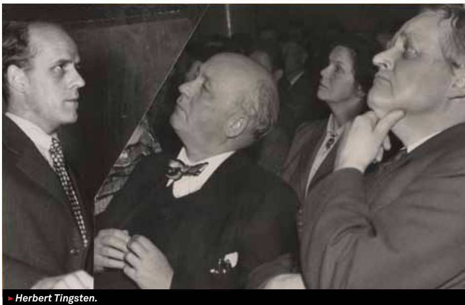
► Herbert Tingsten.