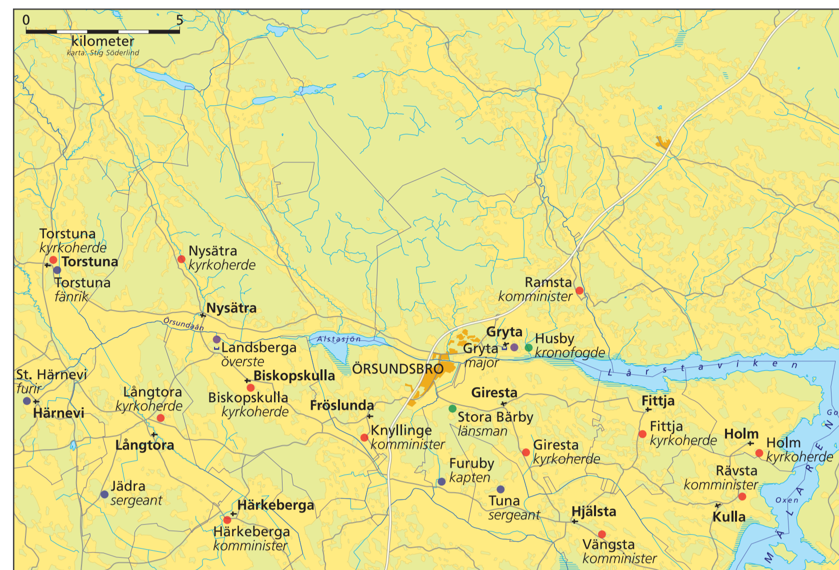
I Örsundaåns dalgång fanns 20 statliga boställen för tjänstemän mellan ca 1680 och 1910. Utöver dessa fanns även klokarboställen vid varje kyrka. Huvuddelen var kyrkliga boställen (röda), men här fanns också militära (lila) och civila (gröna). Ju högre rang, desto större boställe. Överst på Landsberga hade en gård som motsvarade 20 bondgårdar i storlek medan komministrars gårdar var lika stor som en bondgård.

Under 1800-talets sista decennier industrialiserades landet och i den nya mer urbana ekonomin blev allt fler tjänstemän löneanställda. Det militära och civila indelningsverket upplöstes redan på 1870-talet. För prästerna dröjde det till 1910 tills tiondet avskaffades och jordbruket skiljdes från prästgårdar.