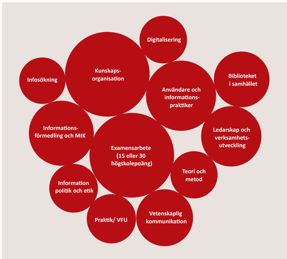
Figur. 1: Biblioteks- och informationsvetenskapliga delområden vid de svenska utbildningarna.

Nedan beskrivs kort innehållet i de biblioteks- och informationsvetenskapliga utbildningarna vid respektive lärosäte: