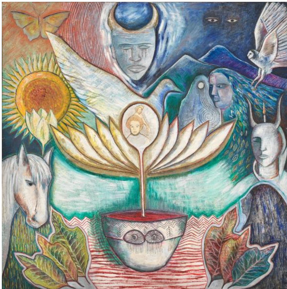
Bild 4. Rebirth from the Motherpot , Monica Sjöö, Olja på duk. 1986.

Löv sticker symmetriskt upp ifrån den nedre kanten och ramar in tavlan. En dekorerad skål befinner sig i mitten fylld med en röd vätska. En häst, uggle, fjäril och fågel, möjligtvis en duva. Olika mänskliga skepnader befinner sig även i bilden. Två kvinnor med svepande hår som döljer deras kroppar. En skepnad med horn och ett ljus, ett par ögon utan kropp som tittar på åskådaren. I mitten befinner sig en cirkel som avbildar ett barn och en vuxen, var en linje sträcker sig ifrån cirkeln ner till en skål fylld med röd vätska, till skillnad från resten utav tavlan är dessa individer målade mer realistiskt, kanske att ett fotografi har varit referens. Bakom dem sträcker sig en blomliknande växt ut, samt ett kroppslöst huvud med horn. Färgerna i tavlan är tydligt uppdelade, den vänstra delens bakgrund har en röd horisont med den gula fjärilen och solrosen, samt befinner sig bara djur och växtligheter här. Löven på denna sida har klara gröna färger. Den vänstra sidans horisont är mörk, med figurer målade i mer mörka, blå nyanser, löven till höger börjar mörkna och gula.