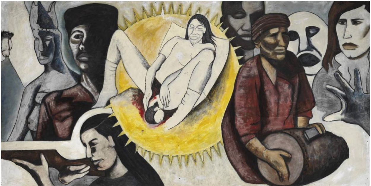
Bild 1. Birth and the struggle for liberation , Monica Sjöö. 1970. olja på duk.

I mitten av tavlan befinner sig en sol som ramar in en kvinna mitt i akten att föda barn. Runt om dem ser vi ett flertal gestalter. En kvinna hållandes ett vapen, en person med halva ansiktet i skuggor som blickar bort mot mamma och barn. En kvinna med en huvudbonad, samt ett manligt skrev. På den högra sidan ser vi ännu ett ansikte halv dolt i skuggor. En person i en röd tunika och hatt håller en trumma. Ett ansikte eller mask med en öppen mun. En utsträckt hand, samt en kvinna med brunt långt hår, vilket är den enda i tavlan som tittar mot händelsen i solen. Valörerna är skarpa, men intensiteten av färgerna är något nedtonade, exklusive solen och blodet.