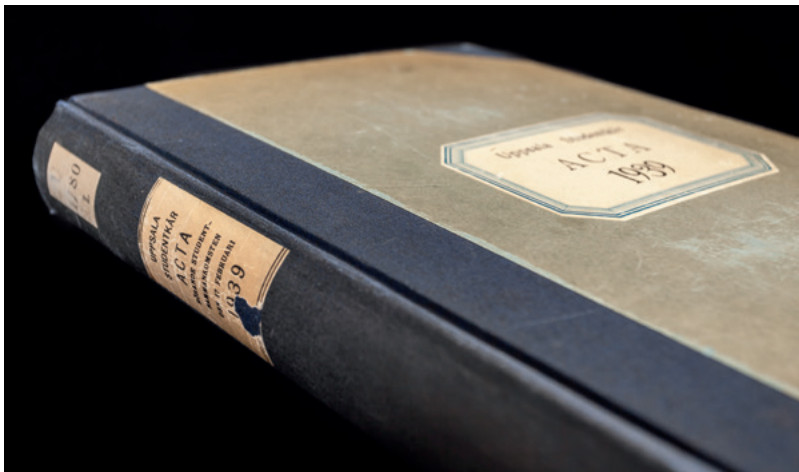
Katalogsignum U 1780 Z. "Uppsala studentkår Acta rörande studentsammanskomsten den 17 februari 1939", den så kallade "Bollhusfolianten", omskriven av Ola Larsson i Djävulssonaten (2007).