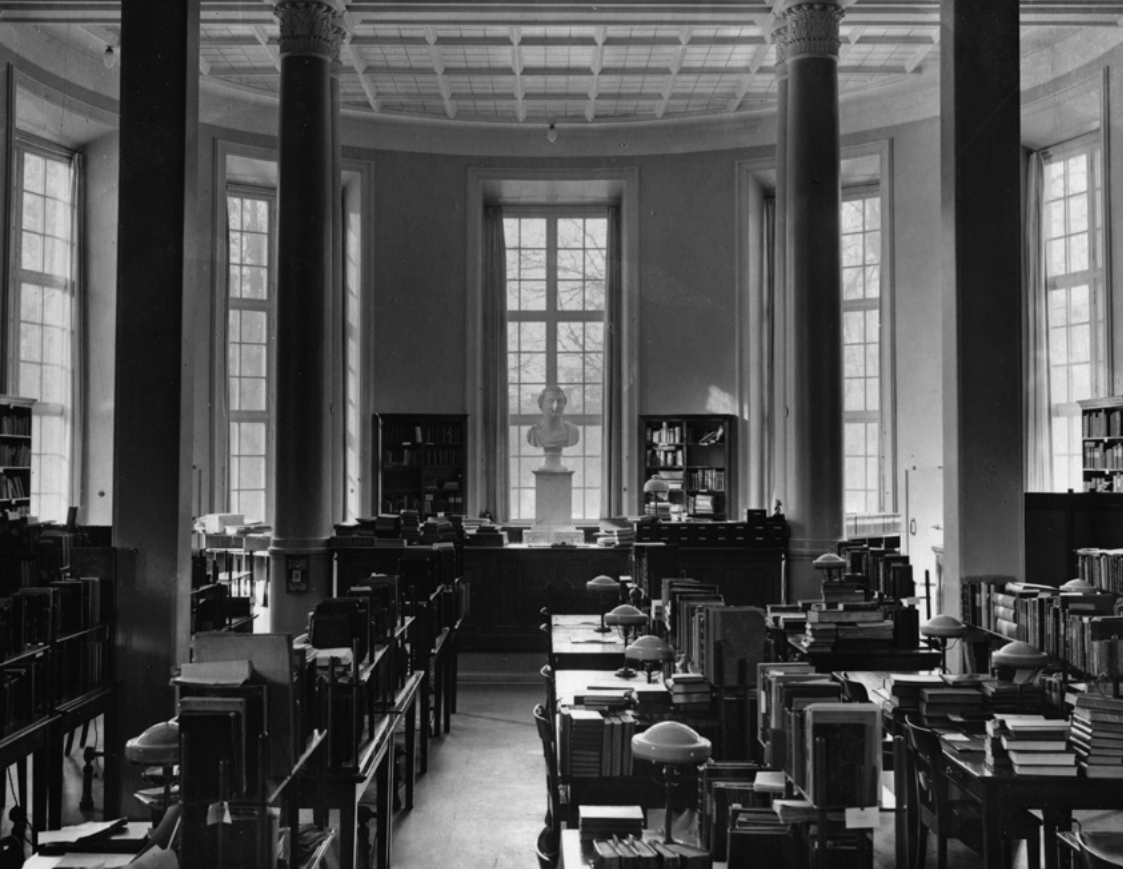
Absiden i A-salen, som den såg ut efter ombyggnaden i början av 1900-talet. Foto från 1926. Alvin-record: 95734. UUB.

skedde när hon var student i Uppsala. 6 Bland dessa maskar fanns studentpoeter som Einar Malm och Nils Svanberg. Alla tre var de flitiga användare av Carolina Redivivas läsesalar. Malm minns hennes respektgivande studiefлит: "Vilka personliga konflikter hon än hade att brottas med satt hon här som en mönsterbild av den hängivna studiepassionen, tillsynes ett med biblioteksmiljön [...]". 7