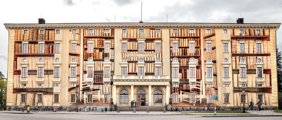
Bokpalatset Carolina Rediviva. "Böcker, böcker, böcker från golv till tak", ur Sigfrid Siewerts Jonas och draken (1928).