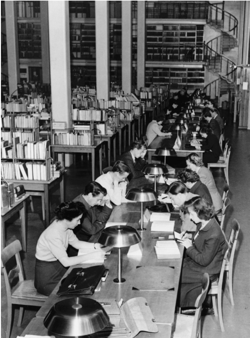
"Barnbordet" i läsesal A. Foto från 1949. Alvin-record: 95705. UUB.