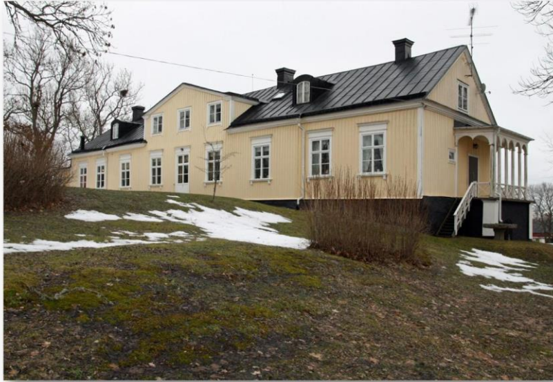
Huvudbyggnaden på Bäddarö säteri idag.

emot bostaden, resterna av trädgården och så de två paviljongerna. Kvar i trädgården låg även en rud-damm.